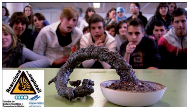
FIGURA 5. Química Recreativa per a la Divulgació Científica. Foment de vocacions científiques.

Un bon recull d'experiments, obtinguts fruit de la recerca, permet organitzar tallers que s'adaptin al temari interessant per a l'aula en qüestió. D'aquesta manera, els experiments recreatius permeten introduir i repassar tots els conceptes del pla d'estudis de l'educació secundària obligatòria i el batxillerat en un ambient distès, cosa que facilita la interacció i l'aprenentatge. Finalment, per amplificar la tasca divulgativa i allargar-la més enllà de l'activitat a l'aula, s'ha dissenyat el web del projecte «Reacciona... explota!», 26 acompanyat de les xarxes socials corresponents.