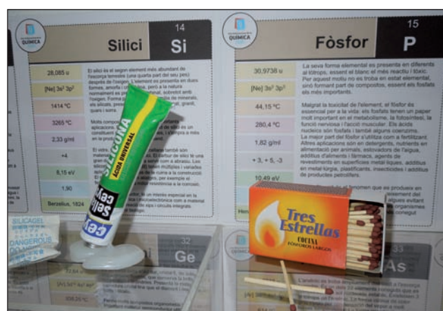
FIGURA 3. Detall de l'exposició «Els elements entre nosaltres», a la planta baixa de la Facultat de Ciències de la UdG.

El passat 2011, un altre projecte didàctic i divulgatiu innovador va ésser dissenyat i dut a terme amb motiu de la celebració de l'AIQ. «Els elements entre nosaltres» 22 és un projecte dissenyat des de la UdG amb l'objectiu directe de crear ponts entre la universitat i l'escola o l'institut, consistent en el disseny d'una taula periòdica dels elements a l'engròs amb la participació directa dels centres de secundària per a la cerca d'objectes quotidians representatius de cada element. El treball cooperatiu entre estudiants de diferents centres educatius i els professors i investigadors universitaris per a la construcció d'una taula periòdica amb objectes reals va comportar un gran desplegament de competències transversals, així com una destacada contextualització de la química.