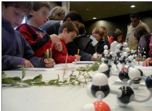
FIGURA 4. Joves estudiants d'educació primària aprenent tot jugant a «El laboratori de les olors». Fira de la Ciència 2011, Fornells de la Selva.

Des de productes de neteja fins a aliments, passant pels fàrmacs. Amb aquests productes químics es duu a terme el taller interactiu, en el qual els alumnes poden manipular i determinar qualitativament el grau d'acidesa de cadascun d'ells mitjançant l'extracte de col llombarda com a indicador de pH natural. Com a experiment estrella, s'acaba preparant una truita a la francesa verda i una llimonada vermella per acompanyar-la; evidentment, són absolutament comestibles, si hem obtingut l'extracte de col llombarda bullint la verdura en aigua.